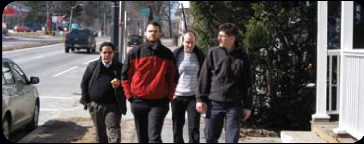
Anunciando el Evangelio por las calles de Methuen y de New Bedford ; abajo: tratando de visitar al siguiente párroco.