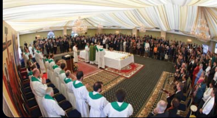
Convivencia de inicio de curso: cada año, los seminaristas participan en una convivencia con sus comunidades durante un fin de semana, marcando el comienzo del nuevo año pastoral.