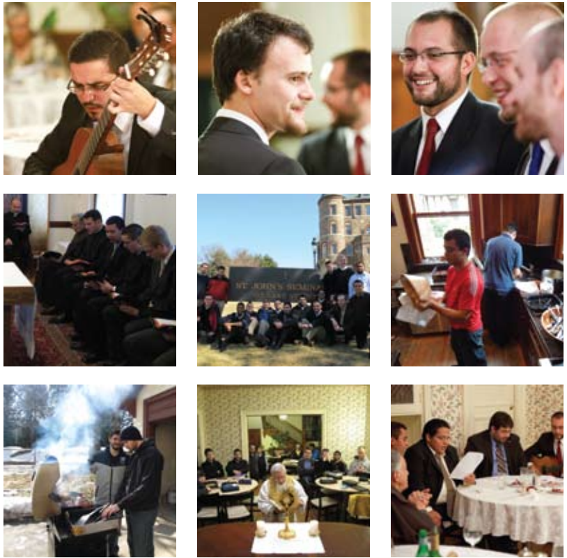
Vida en el Seminario